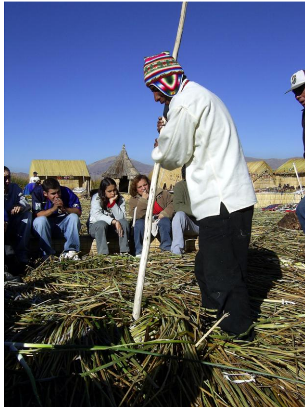
Fig. 3: Turismo comunitario en la comunidad de Uros, Puno. Un miembro de la comunidad está mostrando a los turistas la estructura de la tradicional isla de totora.