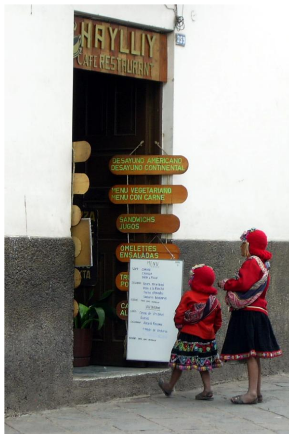
Fig. 4: Turismo en la ciudad de Cusco. Estas dos muchachas vestidas de la manera tradicional se dejan sacar fotos con los turistas.