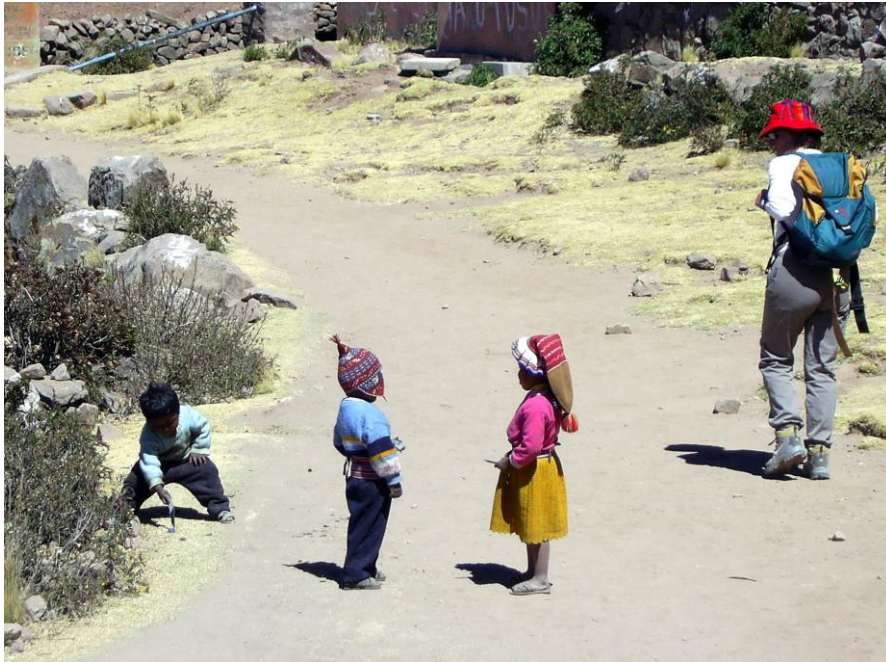
Fig. 1: Turismo comunitario en Taquile, Puno. Una turista está observando a los niños taquileños vestidos de la manera tradicional.