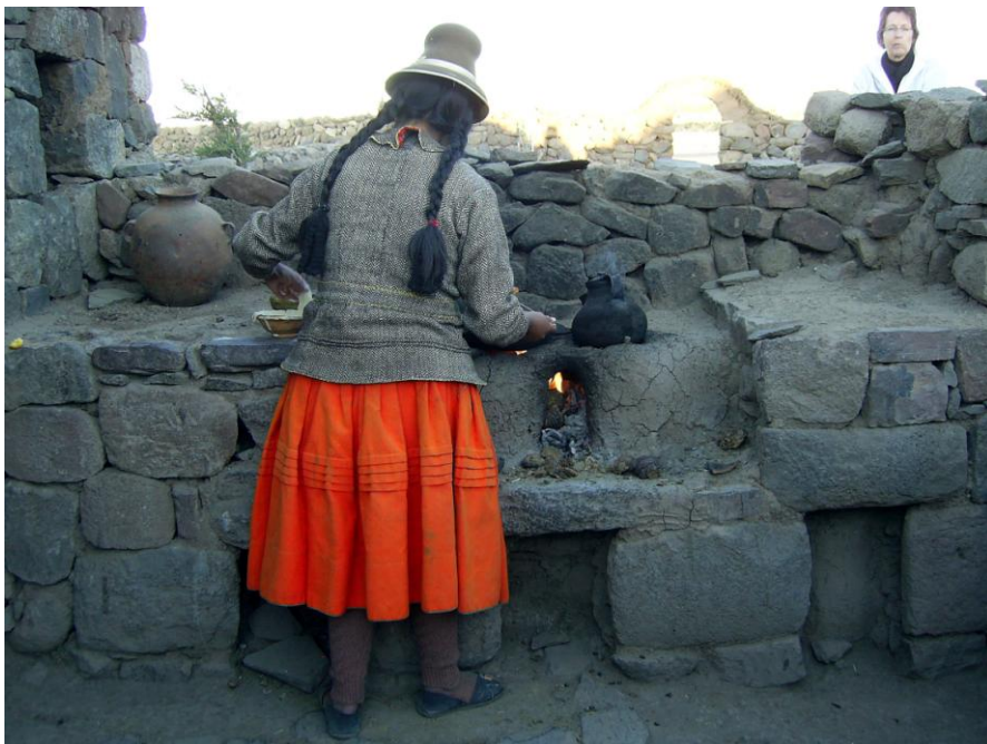
Fig. 2: Turismo comunitario en Sillustani, Puno. Una señora puneña presenta su hogar a los turistas, preparándoles una comida típica.